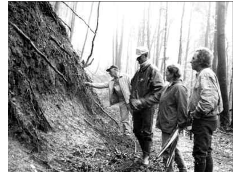
Abb. 1: Ortsbegehung Alt-Heiligenberg am 25.06.1997 mit dem Heimatverein Heiligen- berg.