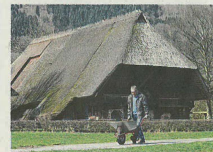
Im Schwarzwälder Freilichtmuseum Vogtsbauernhof in Gutach ist dieses Jahr „Heimat.Zeiten“ das Schwerpunktthema.