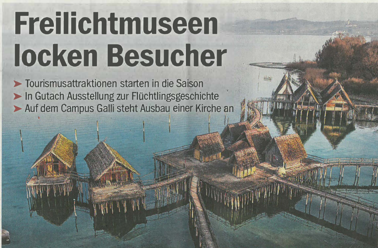
Die Pfahlbauten in Uhdlingen-Mühlhofen sind eine originalgetreu nachgebaute Siedlung aus der Stein- und Bronzezeit.

Uhdlingen-Mühlhofen (sk/dpa) Mit den ersten warmen Tagen öffnen auch viele Freilichtmuseen und Tourismusattraktionen wieder ihre Türen. Ein Überblick über die Attraktionen: