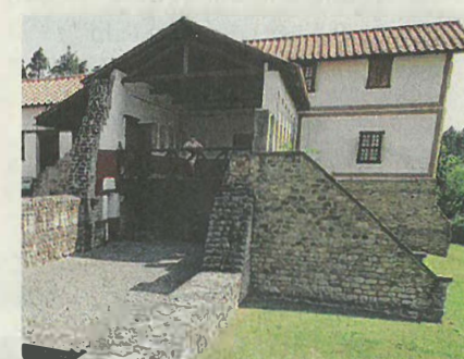
Kinder besichtigen die Überreste des römischen Gutshofes „Villa rustica“ auf dem 4000-Quadratmeter-Gelände in Hechingen.