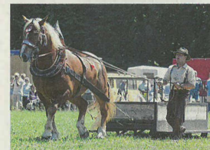
Jeden Sommer gibt es im Freilichtmuseum Neuhausen ob Eck einen Fuhrmannstag. Dieses Pferd tritt beim Zugwettbewerb an.