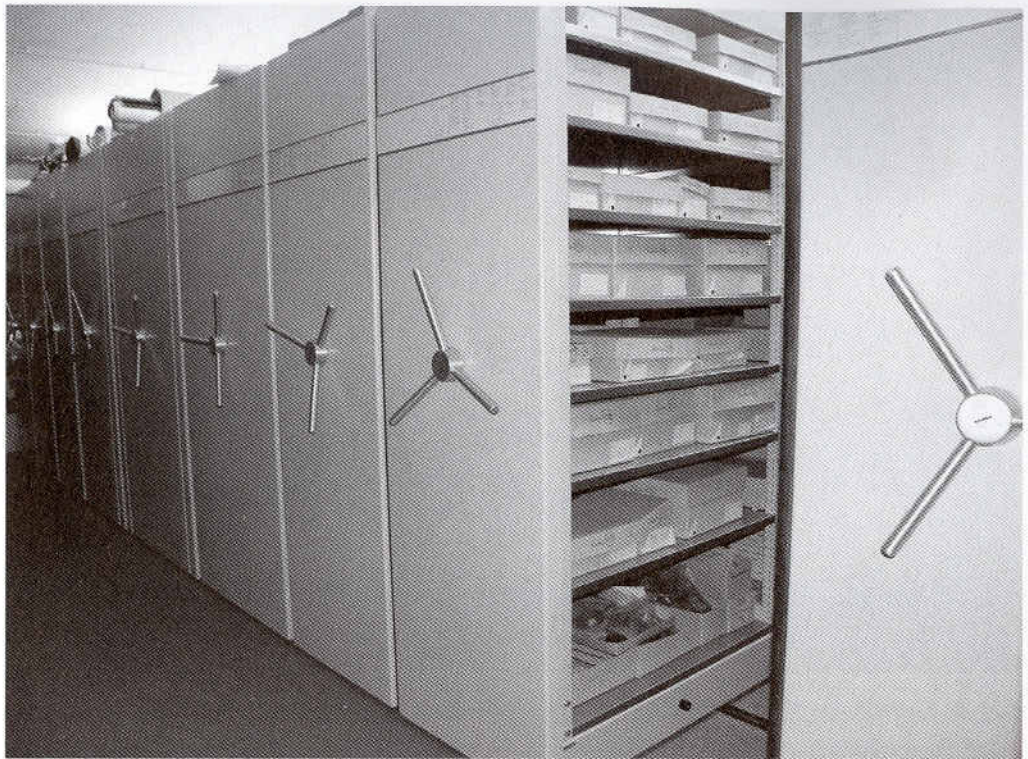
Abb. 3. Der Kompaktus des Fundmagazins des Pfahlbaumuseums Unteruhldingen.

Wechsel- und Sonderausstellungen – etwa für die neue anlässlich des 150-Jahre-Pfahlbauforschungsjubiläums 2004 errichtete Sonderausstellung „Mensch im Pfahlbau“ – intensiv genutzt. Die direkte und einfache Didaktik arbeitet unter Anwendung von Modellen, Dioramen und Inszenierungen, welche gerade von einem zu bedienenden breiten Bevölkerungsquerschnitt gut angenommen wird.