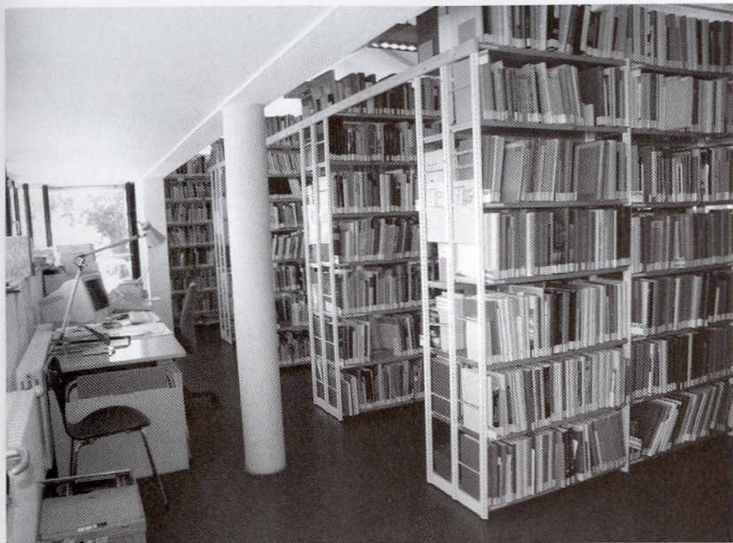
Abb. 4. Die Präsenzbibliothek des Pfahlbaumuseums Unteruhldingen, Stand 2007.

regelmäßigen Neuerwerbungen sind Schenkungen und Zukäufe von Bibliotheken zu bemerken. Größere Eingangsbestände entstammen den ehemaligen Fachbibliotheken folgender Ur- und Frühgeschichtler.