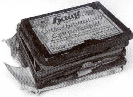
Abb. 6. Konvolut von Glasplattennegativen, Pfahlbaumuseum Unteruhldingen.

kamen aus den wissenschaftlichen Bearbeitungen Hans Reinerths zahlreiche Ausgrabungsdokumentationen, Aufnahmen von Ausstellungen oder Publikationen aus der Zeit vor und während des Zweiten Weltkrieges aus Europa und Deutschland hinzu. Durch die Tätigkeiten des Vereins, aber auch durch die wissenschaftlichen Tätigkeiten des Forschungsinstitutes wuchs dieser Sammlungsbestand rasch. Ab 1954 erfolgte im hauseigenen Fotolabor unter wechselnden Fotografen die Aufnahme der umfangreichen Ausgrabungs- und Fundbestände für Publikationen und Vorträge. Seit 1990 wird das Archiv nach Fotografen und wissenschaftlich relevanten Dokumentationsseinheiten geordnet und erfasst. Auch die Sicherung und Konservierung alter Medien wie der empfindlichen Glasplatten (Abb. 6) und die Digitalisierung von Negativen, Abzügen, Diapositiven ist im Gange. Sammlungszukäufe historischer Fotografien, fotografische Nachlässe oder Schenkungen ergänzen den Sammlungsbestand des Foto- und Medienarchivs. Größere Bestände forschungs- und regionalgeschichtlich relevanter Fotografen besitzt das Museum von folgenden Fotografen: