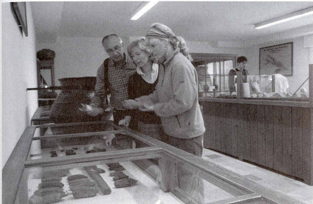
Abb. 1. Blick in den alten Ausstellungsraum des Pfahlbaumuseums aus dem Jahre 1934.