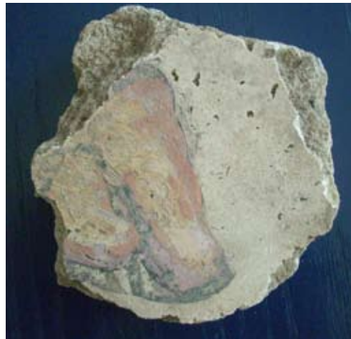
Abb. 9: Fragment eines römischen Wandputzes mit der Darstellung eines Fußes, Mühlhofen ›Schlossbühl‹, Uhldingen-Mühlhofen, Bodenseekreis

Fragmente von blauen Glasarmreifen und Eisenbarrenfunde entlang der Süd-Nord-Achsen des Verkehrs entlang der Flüsse sprechen für einen regen Handel zwischen den Produktionsstätten von Eisen und Salz in den Alpen und dem Bo-