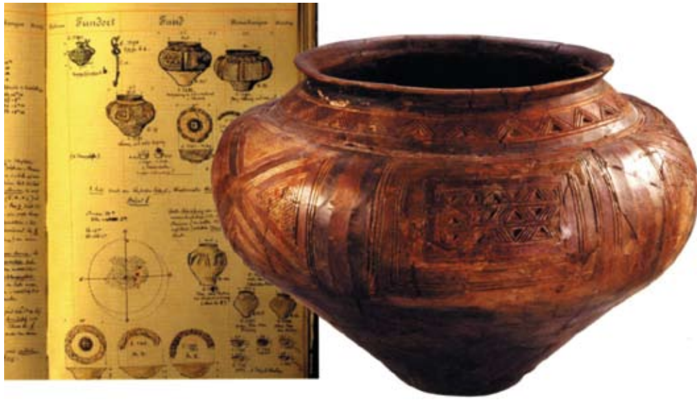
Abb. 7: Grabgefäße Salem-Hardtwald, Alb-Salemer Prägung, Bodenseekreis

rung zur Rotach) mit 80 Stück Bronze – darunter auch Brucherz, Altmaterial und ein urnenfelderzeitliches Aufsteckvögelchen – ist wie auch ein Gusskuchendepotfund bei der Höhensiedlung Heiligenberg als vergessenes, recycelbares Rohmaterial zu erklären. Mondhörner aus Ton für den Kult, Entenvögel und eine allgegenwärtige reiche Symbolik, die durch Strichzier auf Gefäßen in Sonnenform zum Ausdruck kommt, zeigen die hohe Bedeutung naturreligiöser Elemente an. Tonstempel, Rasseln, Kinderspielzeug, Bestandteile von Kultwagen, Klapperbleche und auch eine in Fragmenten erhaltene verzierte Holzflöte aus Hagnau sind sprechende Zeugnisse eines sehr reichen kulturellen und geistigen Lebens.