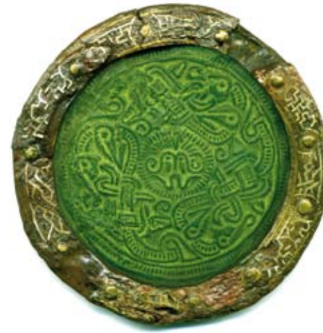
Abb. 10: Bronzene Zierscheibe mit Christusdarstellung, silbertauschierte Eisenfassung (Original und Rekonstruktion), Durchmesser 7,8 cm, Unteruhldingen-›Siechenhölzle‹, Uhldingen-Mühlhofen, Bodenseekreis

Die Seeschlacht gegen die Vindeliker um 15 v. Chr. im Rahmen des römischen Alpenfeldzuges unter Tiberius, dem Adoptivsohn des Augustus, bei der Tiberius eine im Bodensee liegende Insel als Militärbasis nahm, steht am Anfang der römischen Epoche. Sie äußert sich durch verschiedene Hafenfunde am Nordufer, römische Landvillen wie etwa die von Oscar PARET 1930 in Friedrichshafen-Löwental ausgegrabe-