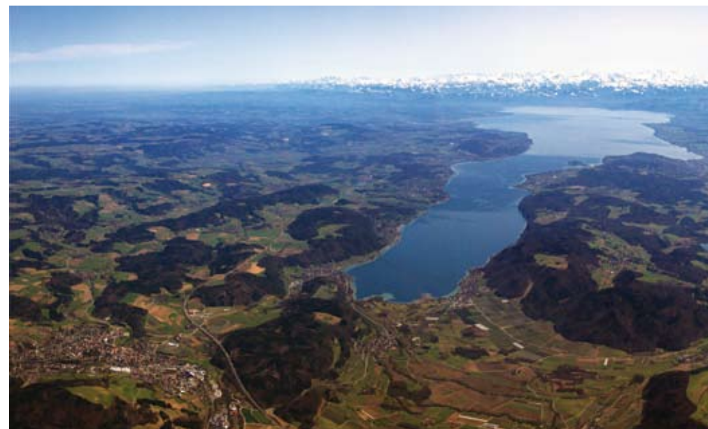
Abb. 1: Blick von Westen auf den Überlinger See, den nördlich anschließenden Linzgau und die Alpen im Hintergrund

Durch den starken Einfluss der Eiszeit auf die Bodenseelandschaft bedingt, finden sich erst gegen Ende des Paläolithikums (Altsteinzeit) Spuren menschlicher Tätig-