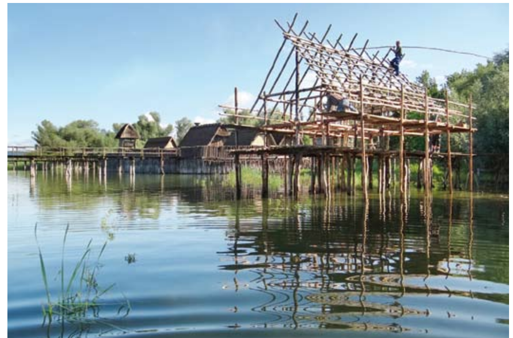
Abb. 3: Rekonstruktion eines steinzeitlichen Pfahlbauhauses nach Ausgrabungen, Vorbild um 3900 v. Chr., im Freilichtmuseum Unteruhldingen

siver Waldeinschlag mit nachfolgendem Ackerbau auf Waldlichtungen erfolgte. Höhenstandorte wie Billafingen->Brunnenbühl<, Frickingen->Alt-Heiligenberg<, Frickingen->Schwedenschanze<, Lellwangen, Owingen->Kaplinz<, Salem-Beuren->Halden<, Ravensburg->Veitsburg< lassen inzwischen erste Spuren einer allem Anschein nach neolithischen Besiedlung erkennen. Einzelfunde von Beilen und Pfeilspitzen bei Sipplingen, Mühlhofen oder im Hinterland von Überlingen, Unteruhldingen und Friedrichshafen deuten auf ehemalige Gräber hin. Zufällig im Gewerbegebiet Frickingen-Altheim->Au< bei Erschließungsarbeiten gefundene Knochen und kleine Keramikscherben geben auch Siedlungsstandorte am Rande der Flusstäler preis. Am besten erforscht sind jedoch die Pfahlbausiedlungen, die zwischen 4.000 und 2.000 v. Chr. in kurzen Abständen