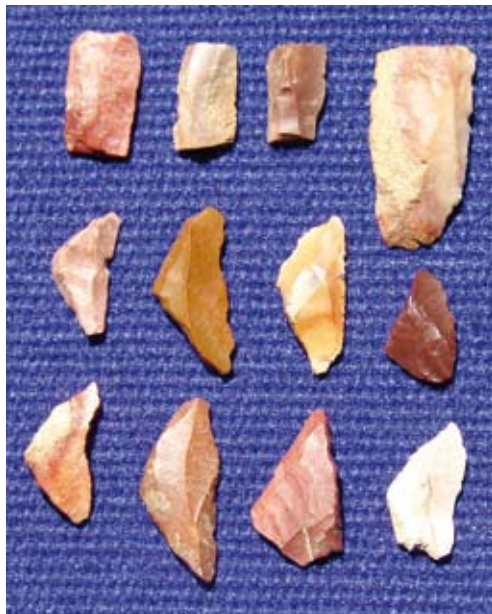
Abb. 2: Mikrolithen der Mittelsteinzeit aus dem Bodenseekreis

Unteruhldingen, Obermaurach, Seefeld und Nußdorf sowie Überlingen fanden sich die Nachweise entlang der alten Uferterrasse. Aber auch landeinwärts – etwa bei Oberuhldingen auf erhöhten Kieskuppen über einer Flussschlinge der Ur-Aach oder im Pfrunger-Burgweiler Ried, das damals noch von einem See umspültes Gelände war – waren die Reste saisonaler Lager der in Familienverbänden ständig umherziehenden Jäger und Sammler festzustellen. Gegenüber dem Menschen der Altsteinzeit kannten die Mesolithiker bereits Pfeil und Bogen, die sie als Waffe vornehmlich für Kleinwild und Wasservögel in der offenen Flusslandschaft einsetzten. Harpune und Angel waren hervorragend geeignet, um im Flachwasser der Seen oder der einmündenden Flüsse auf Fischfang zu gehen. Die Randgebiete des Urwalds boten reichlich Nahrung an Sammelfrüchten.