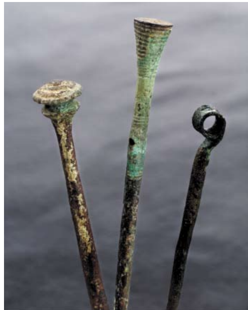
Abb. 6: Pfahlbaubronzen Unteruhldingen-Stollenwiesen, Bodenseekreis, 17. bis 9. Jh. v. Chr.

Die etwa 20 Seeufersiedlungen von Konstanz bis Immenstaad am westlichen Bodensee (1.050 bis 850 v. Chr.), von denen einige schon während der Pfahlbausuche im 19. Jahrhundert und heute mithilfe der Methoden der Taucharchäologie genauer unter-