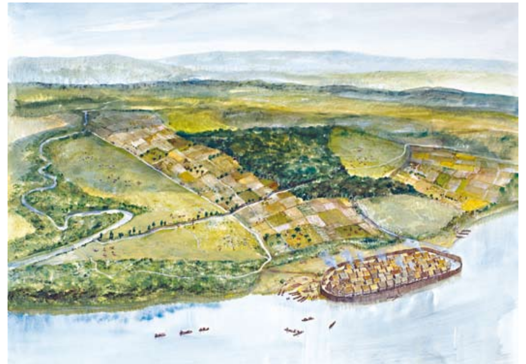
Abb. 5: Rekonstruktionszeichnung der spätbronzezeitlichen Pfahlbausiedlung Unteruhldingen-Stollenwiesen um 970 v. Chr. (Vorlage: Pfahlbaumuseum, G. EMBLETON nach GUNTER SCHÖBEL)

Gegen Ende des 14. Jahrhunderts v. Chr. werden die Pfahlbaustandorte vorläufig verlassen. Auch die Landschaftszeiger in