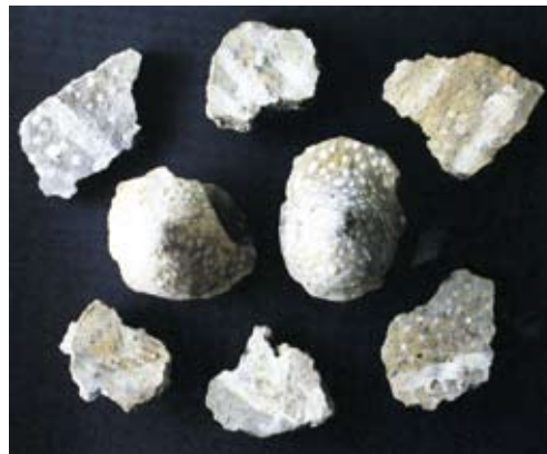
Abb. 4: Kulthaus Ludwigshafen, Kreis Konstanz. Wandmalereien und Brustapplikationen der Pfyner Kultur, um 3865 v. Chr. (Vorlage: Landesamt für Denkmalpflege Baden-Württemberg beim Regierungspräsidium Stuttgart, M. ERNE)

zige Bohrer und längliche Kalksteinperlen aus Horn am Untersee, bei Bodman, Unteruhldingen und Konstanz zeigen, dass es bereits um 3.900 v. Chr. eine einfache Manufakturproduktion und einen florierenden Handel mit Schmuckketten über weite Strecken gab. Italienischer Feuerstein oder solcher aus dem heutigen Bayern, aus Belgien oder aus Norddeutschland wurden dagegen getauscht. Der transalpine Austausch von Waren war wie der entlang der großen Flüsse Donau und Rhein prägend